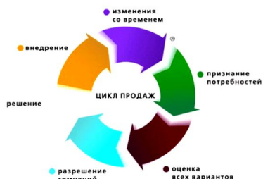
Рис. 2. Цикл принятия клиентом решения

То, что это уже ваш клиент, – слабое утешение. На практике довольно часто необходимо вновь и вновь доказывать клиенту, что вы лучшие, поскольку у него (клиента) есть свое представление о критериях выбора страховой компании (по данному конкретному риску) и предлагаемых условиях страхования.