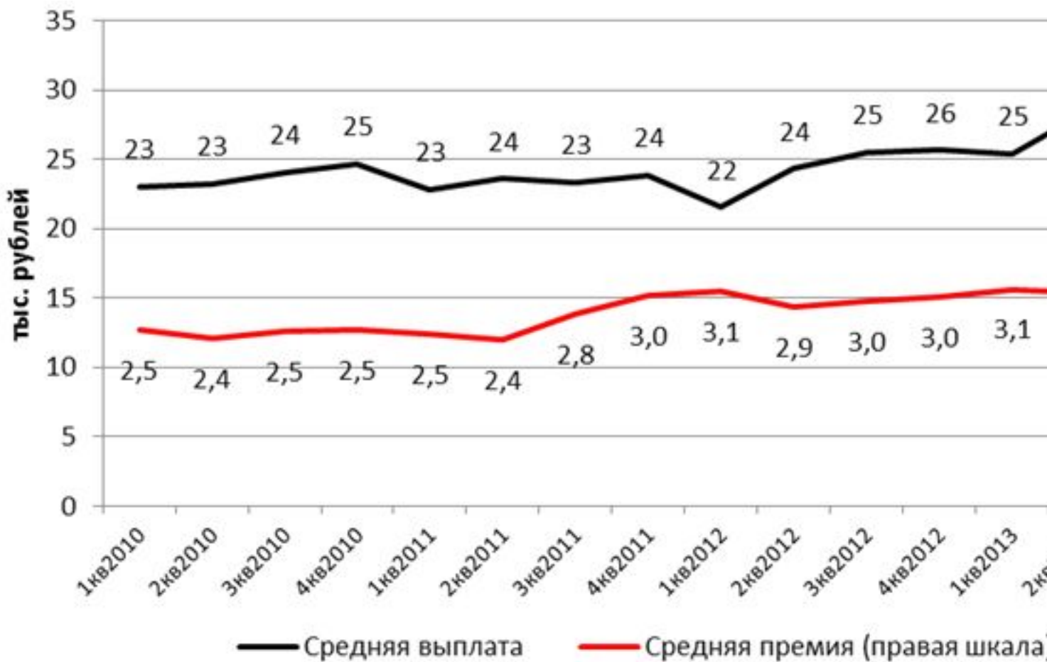
Рис. 1. Динамика средней премии и выплаты

роста выплат по обязательной «автогражданке». В особой зоне риска находятся те страховщики, ОСАГО в портфеле которых составляет более 33% – усредненный комбинированный коэффициент убыточности-нетто для таких компаний составляет более 100%.